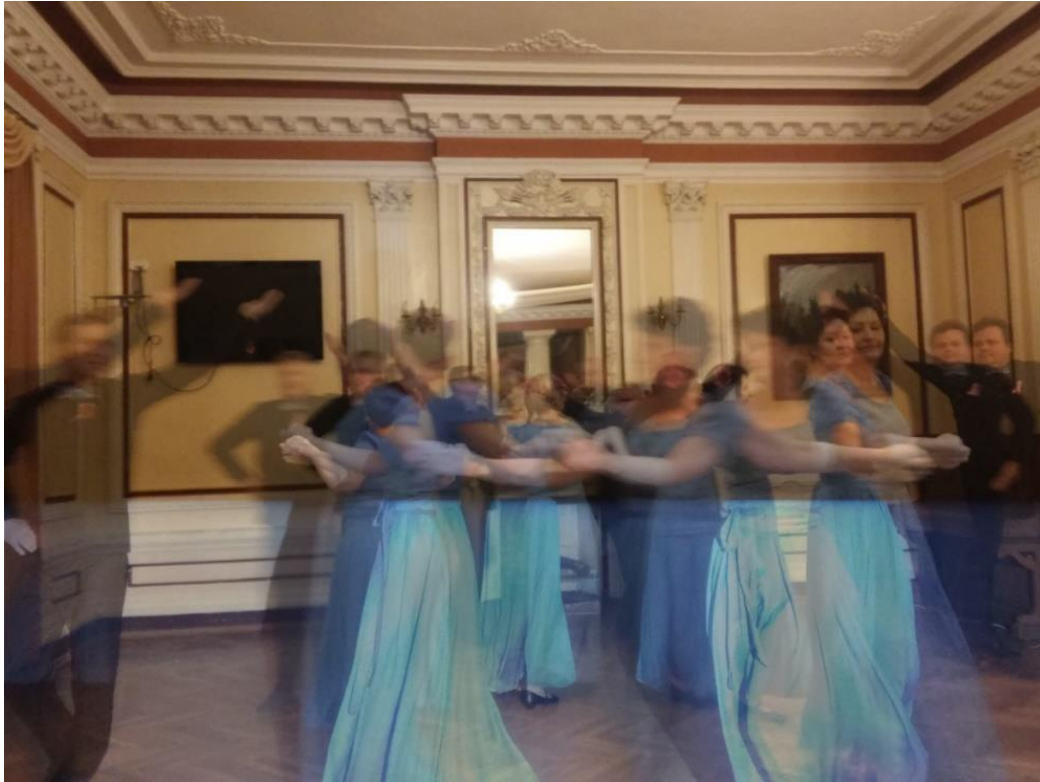
Polonez salonie w wykonaniu zespołu ROSA – zespołu tańca gminy Janowiec podczas Wieczornicy Patriotycznej z okazji 100-lecia Odzyskania Niepodległości.

W parku, naprzeciwko oranżerii wyróżnia się sztucznym kształtem tzw. ślimak – niewielki kopiec, który przed II wojną okrążała wąska ścieżka obsadzona nisko strzyżonym żywopłotem grabowym, prowadząca na małą platformę mającą być w zamyśle twórców parku miejscem romantycznych schadzek. W jego pobliżu znajdowały się też wówczas korty tenisowe. Ukwieconemu parkowi uroku dodawały spacerujące po nim pawie. Ozdobą parku był też kilkusetletni dąb (570 cm w obwodzie) rosnący nad stawem - powalony podczas burzy w 2011 roku.