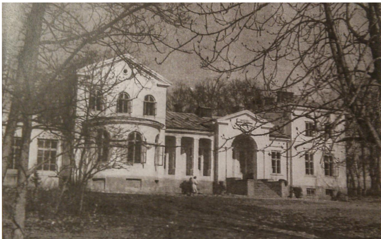
Dwór w Kęble z pomieszczeniem oranżerii przed przebudową (po lewej) – 2 poł. lat 40-tych XX wieku

w kotlinie ciągnącej się u stóp zespołu pałacowo – parkowego.